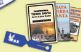
Información completa, etiquetas...