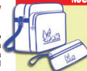
Bolsa y cartera documentación